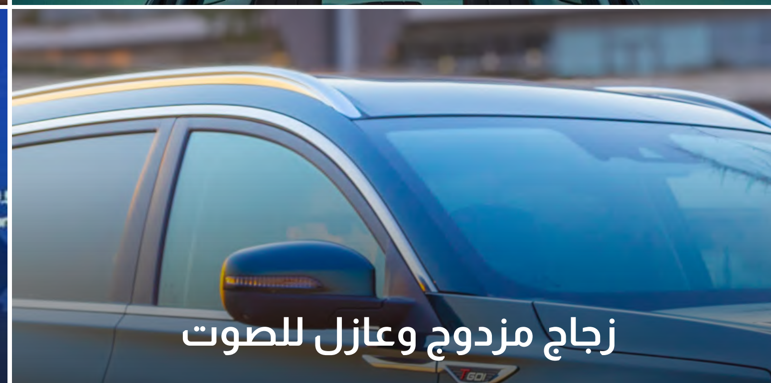
زجاج مزدوج وعازل للصوت