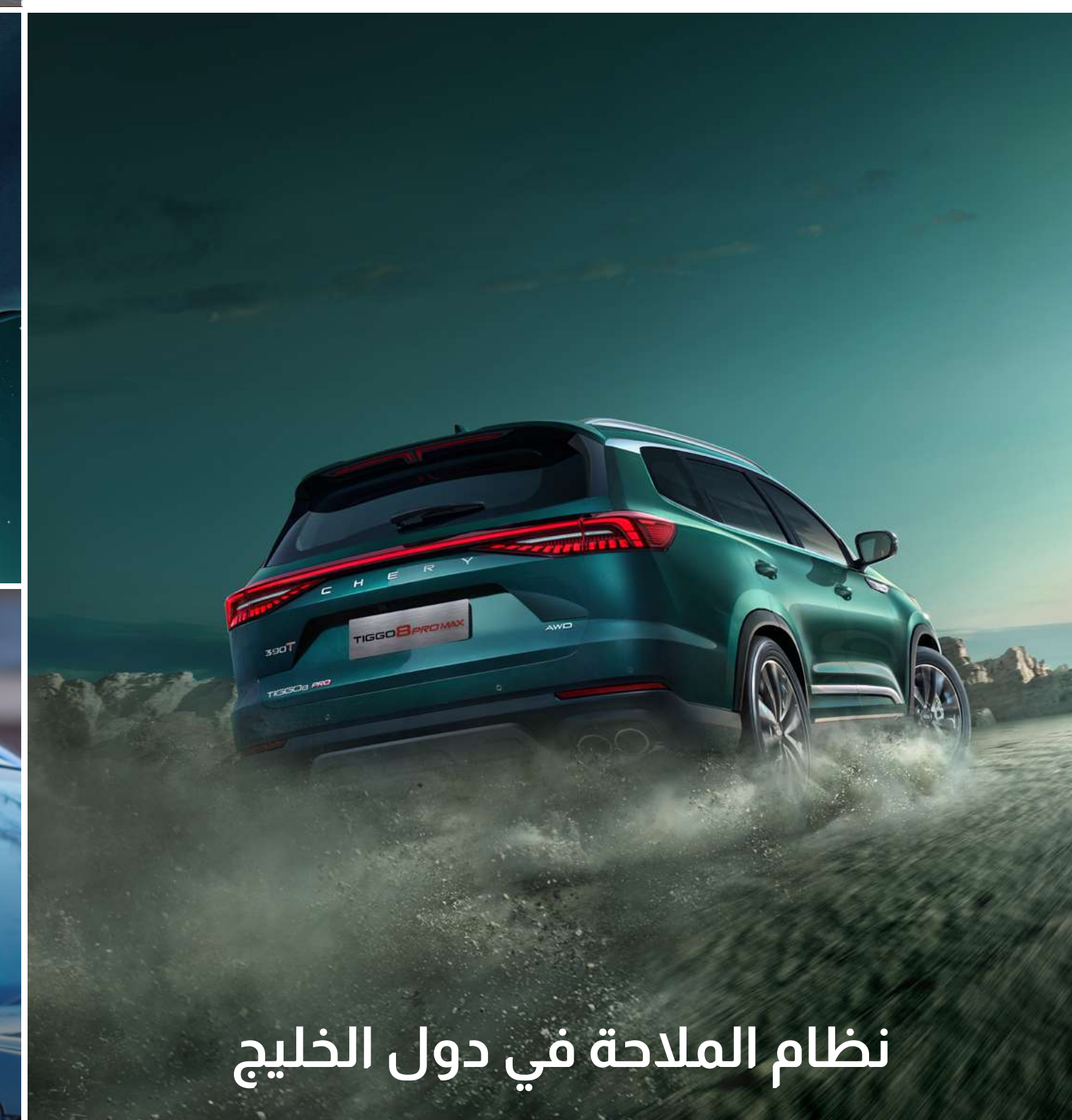
نظام الملاحة في دول الخليج