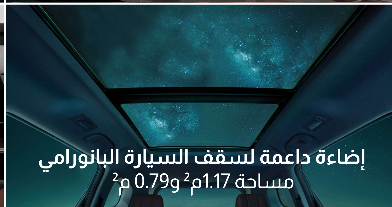
إضاءة داعمة لسقف السيارة البانورامي مساحة 1.17م 2 و0.79م 2