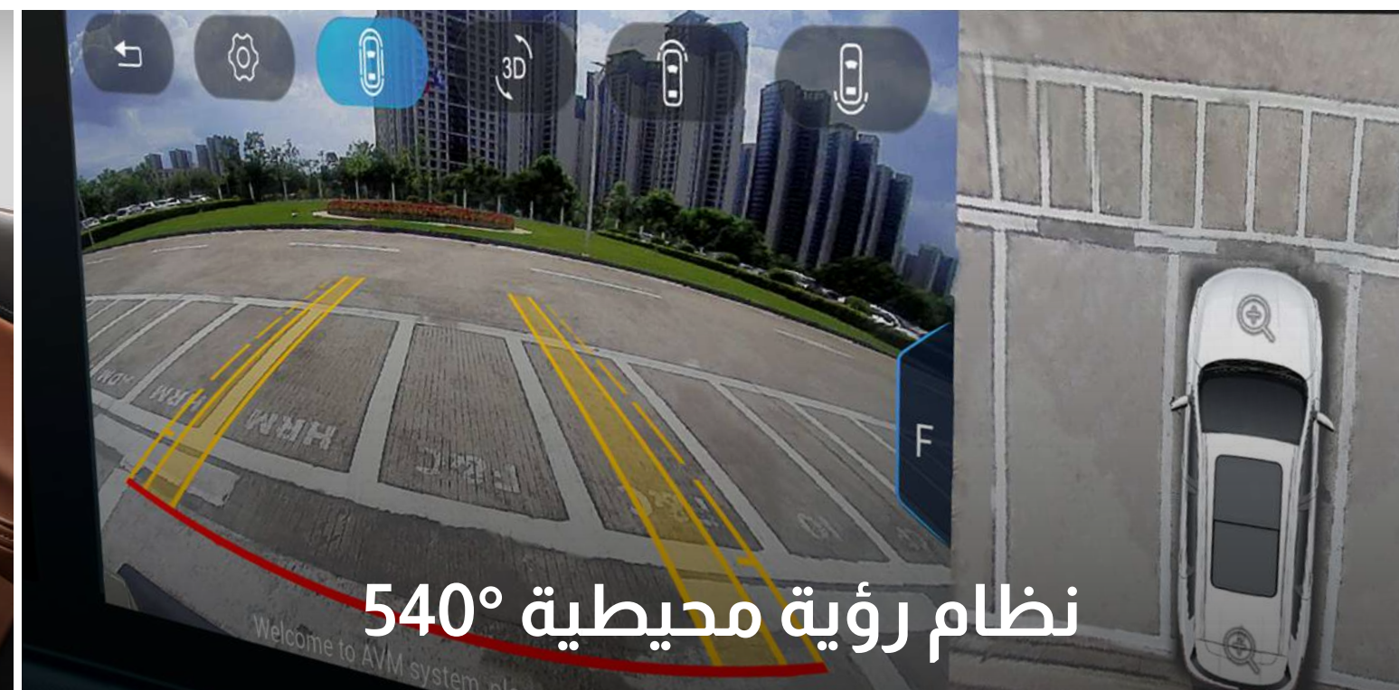
نظام رؤية محيطية 540°