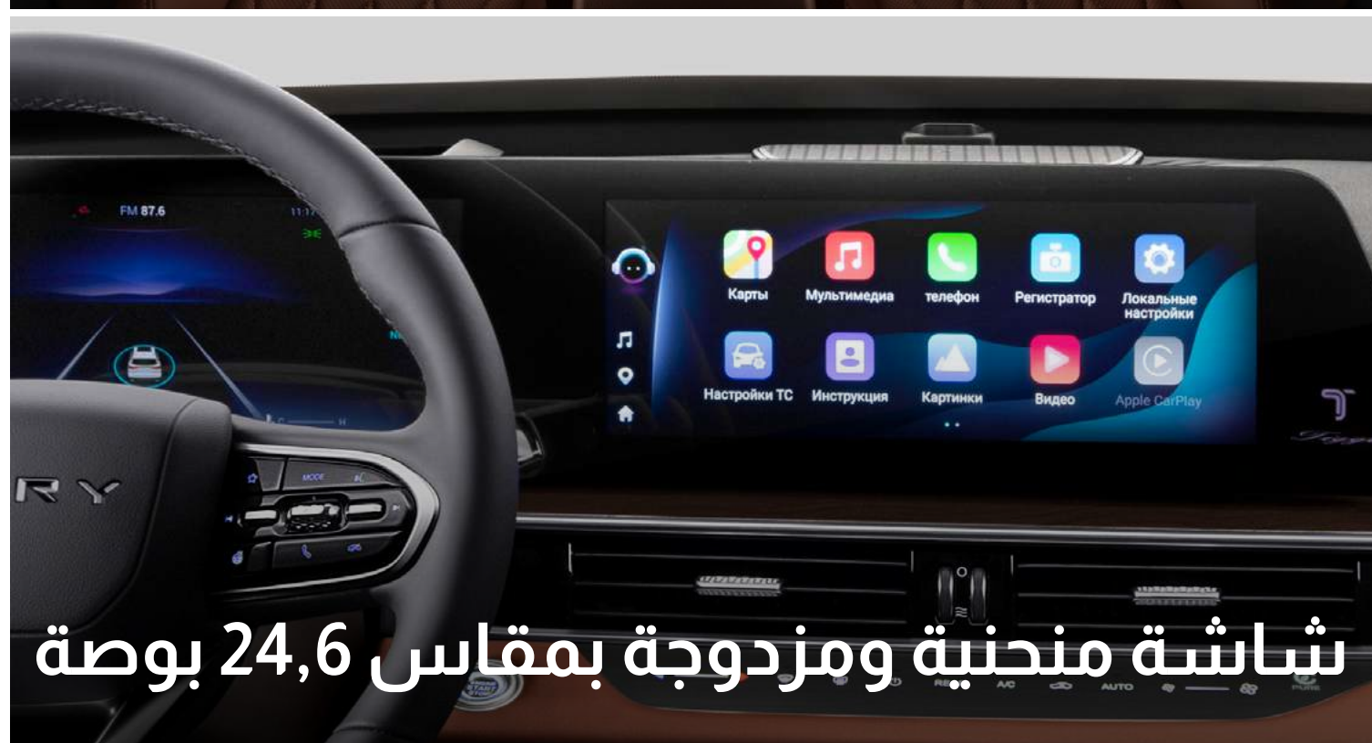
شاشة منحنية ومزدوجة بمقاس 24,6 بوصة